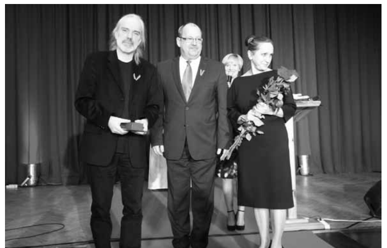
Ingu un Uģi Prauliņus Alūksnes novada ļaudis jau pieņēmuši par savējiem, pateicoties viņu aktivitātēm, atjaunojot Ērmaņu muižas kungu māju un veidojot šai vidē jaunu, mājīgu kultūras telpu ar kvalitatīvu un augstvērtīgu piedāvājumu