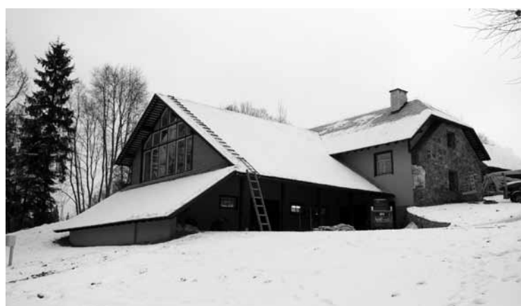
Jaunā „Laidara” ēka Viktora Ķirpa Ates muzejam sniegs jaunas iespējas

arī ziemā varētu apmeklētājiem piedāvāt dažādas izglītojošas programmas, pasākumus un nodarbinātības, kalpos jaunbūvētā ēka. Tās pirmajā stāvā plānots izvietot muzeja krājumu, nodrošinot tā saglabāšanu un plašāku pieejamību iedzīvotājiem, bet otrajā stāvā būs jaunas izstāžu un nodarbinātības telpas. Telpu iekārtošana un ekspozīciju izveide tiks veikta pakāpeniski par pašvaldības līdzekļiem.