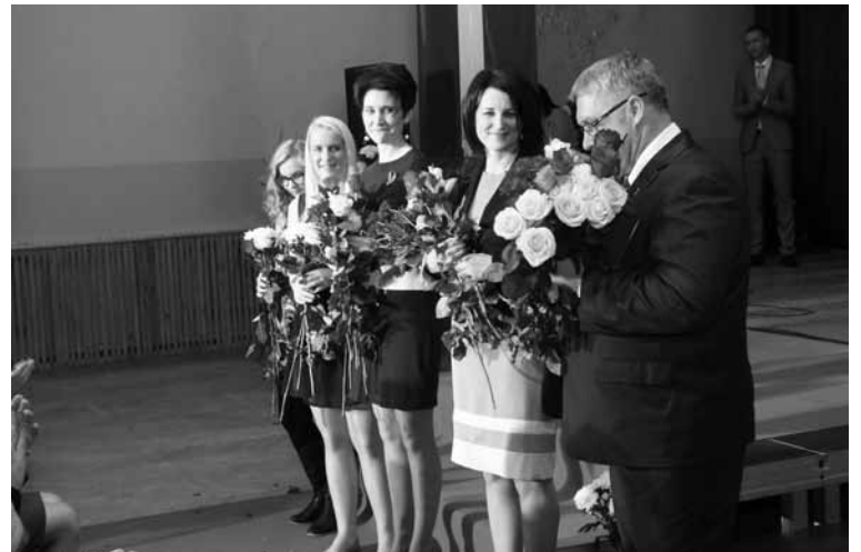
Biedrības „Astes un ūsas” komanda ir pratusi uzrunāt sabiedrību, aicinot palīdzēt dzīvniekiem iegūt jaunas mājas un uzlabot viņu pagaidu mītni dzīvnieku mājā „Astes un ūsas”