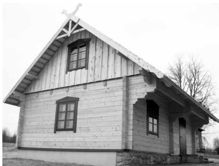
Bejas novadpētniecības centram rekonstruēta klēts

2013. gadā Gulbenes SIA projektēšanas birojs „PROJEKTS” izstrādāja tehnisko projektu avārijas stāvoklī esošās klēts rekonstrukcijai. 2014. gadā, veicot būvdarbu iepirkumu, piedāvātā pakalpojuma cena pārsniedza rekonstrukcijai paredzētos budžeta līdzekļus. Lai īstenotu ieceru, tika ieguldīta daļa līdzekļu no Alūksnes novada pagastu teritoriālo vienību infrastruktūras un vides kvalitātes