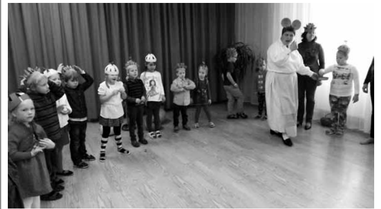
Jaunlaicēnes pamatskolas pirmsskolas grupas audzēkņi kopā ar vecākiem un audzinātājiem svin “Ābolu balli”